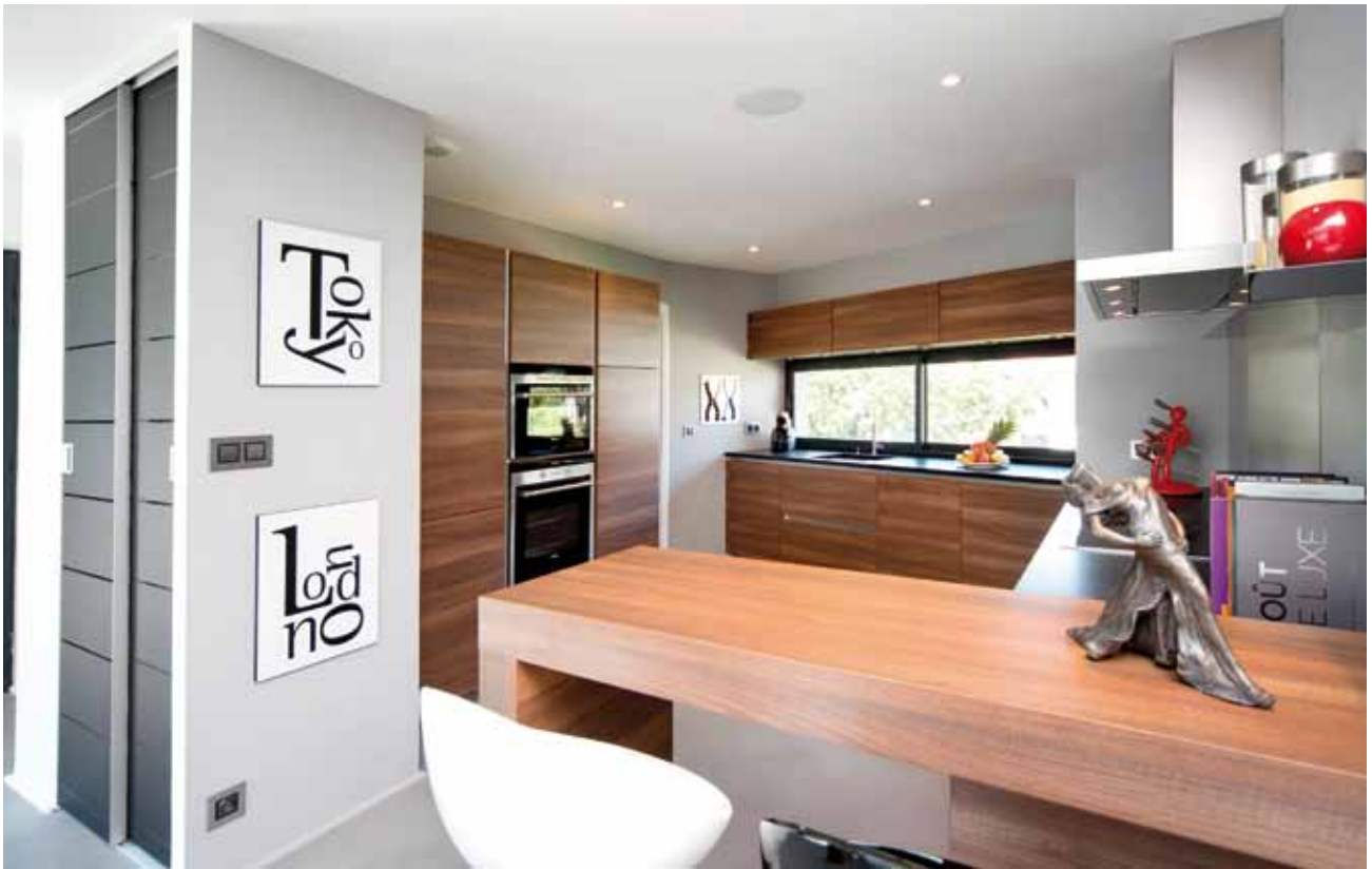
La cuisine réalisée par Bernollin (Lyon 6ème) s'approprie son corner, avec une touche de poésie apportée par la sculpture en bronze de Neige Salas, qui s'exprime librement ( www.neige-salas.fr ).