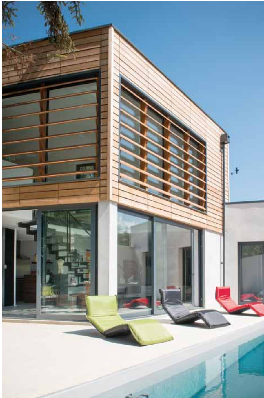
La terrasse extérieure accueille un trio insolite, touche de couleurs ingénieuses : les matelas-transats aussi légers que confortables, découverts chez Espace Ferano (Lyon 2ème).

façonné, par le serrurier ASCR Cellupica (Irigny). Il distribue les volumes et implicitement les délimite, avec légèreté. Ainsi, la cuisine en mélaminé, coloris noyer-tabac, conçue par les Cuisines Bernollin (Lyon 6ème) s'approprie un coin, faisant face à la salle à manger et le coin salon. Côté salle de bains, du carrelage à la baignoire XL, tout est signé Porcelanosa (Limonest). Sur les conseils de l'architecte, nos hôtes ont choisi une implantation domotique, réalisée par Futur In Media (Lyon 4ème), reliée à leur iPhone. D'une seule